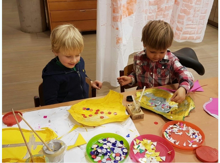
Ridderschild verven en plakken