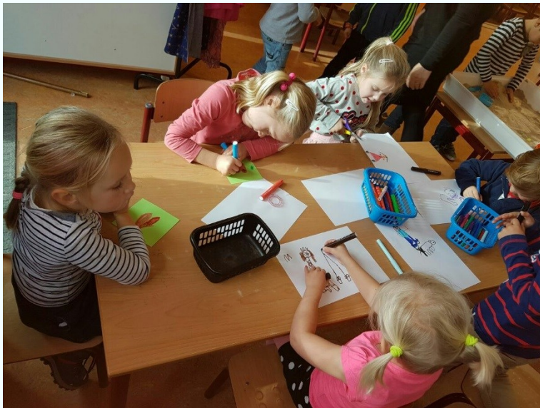
Jonkvrouwen tekenen voor in het kasteel