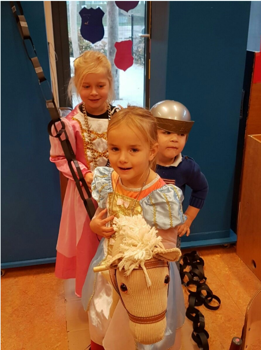
Spelen in het kasteel