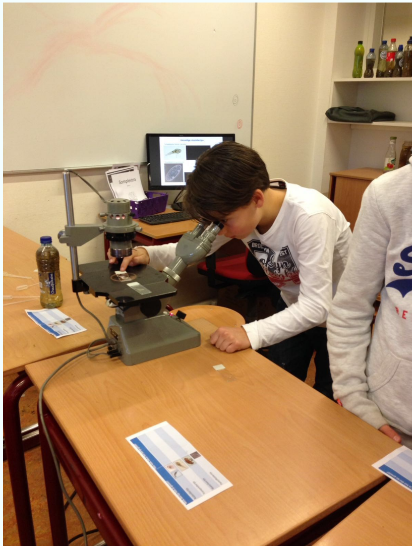
Onderzoeken van 1-cellig organisme

Na de carnavalsvakantie starten we met het thema "maken van een eigen product". Mochten er ouders zijn die hier een bijdrage aan willen leveren, meldt het dan snel bij de juf/meester van de basisgroep.