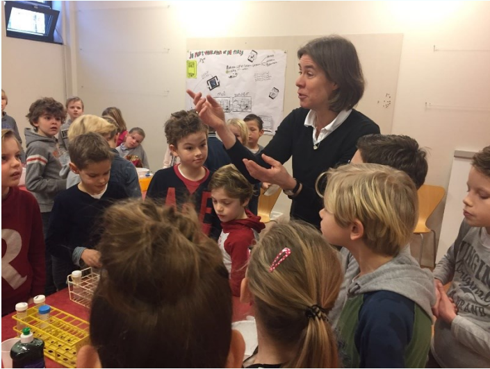
Unit 3 doet proefjes met DNA