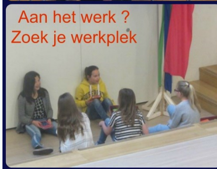
Aan het werk ? Zoek je werkplek