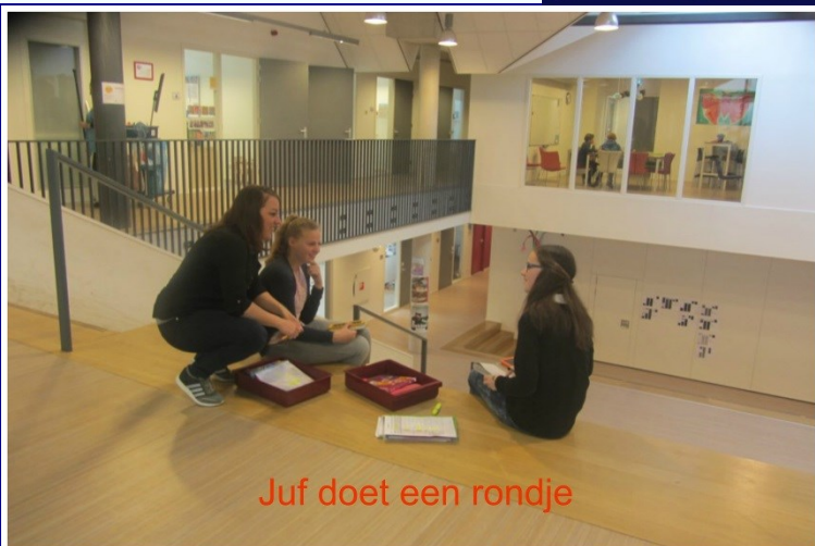
Juf doet een rondje