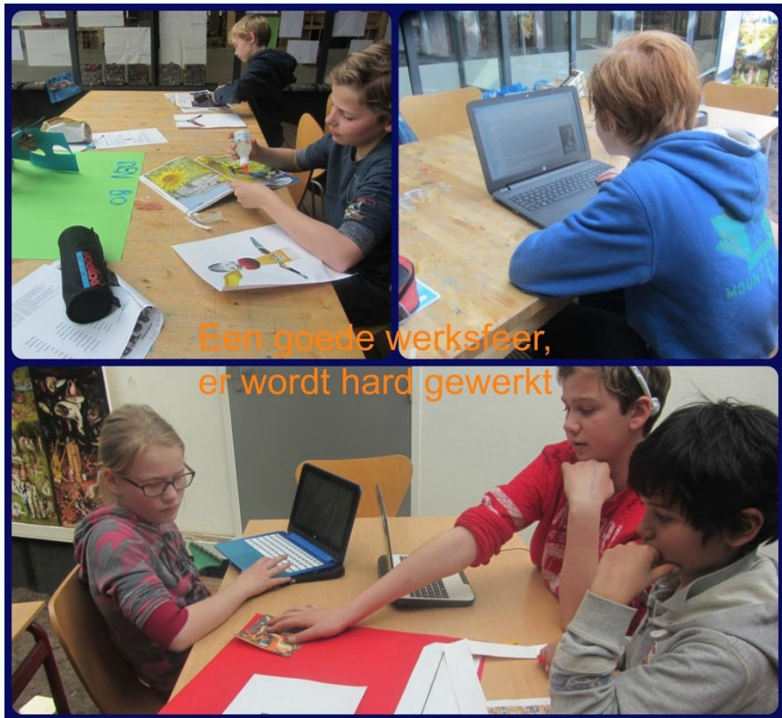
Een goede werksfeer, er wordt hard gewerkt