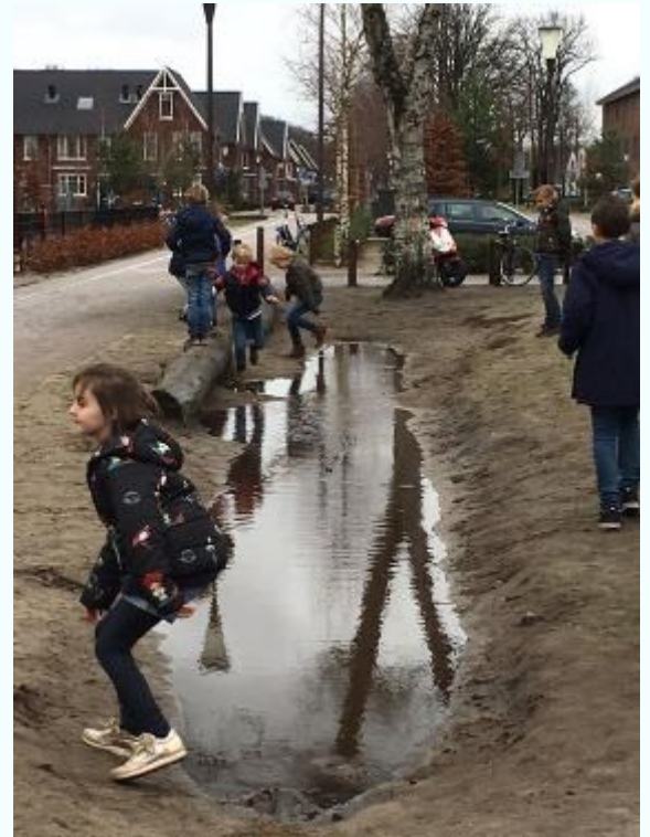
Na al die regen konden de kinderen eindelijk weer eens slotje springen !