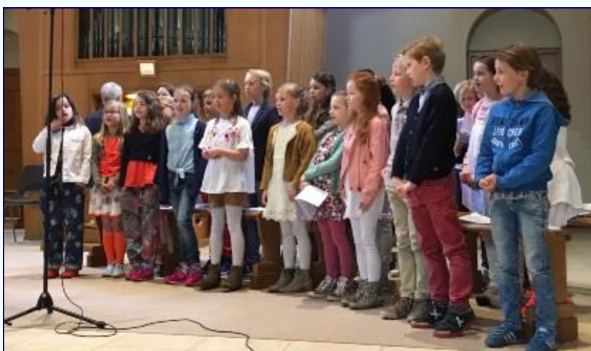
Het Molenvan Communie koor