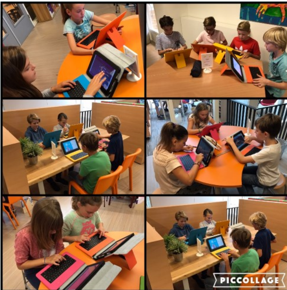
Nieuwe tablets in Unit 4